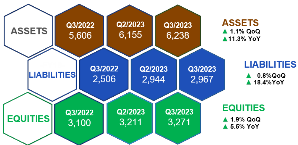
ภาพที่ 3: งบแสดงฐานะการเงินเปรียบเทียบ (แบบรายไตรมาส)

สาเหตุของการเปลี่ยนแปลงจากงบแสดงฐานะการเงินของกลุ่มบริษัท มีรายละเอียดดังต่อไปนี้